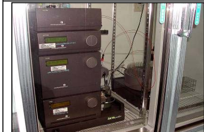
FPLC 快速蛋白層析系統