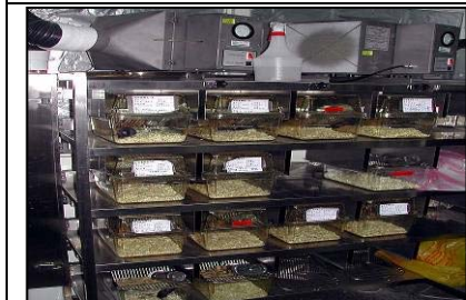
IVC 無菌小鼠飼養系統