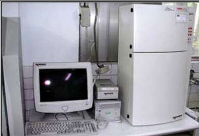
高解析膠片數位照相系統