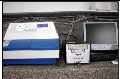
高通量盤式螢冷光分析儀