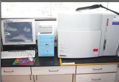
螢冷光膠片照相系統