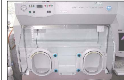
厭氧微生物操作培養系統