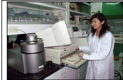
定量 PCR 系統