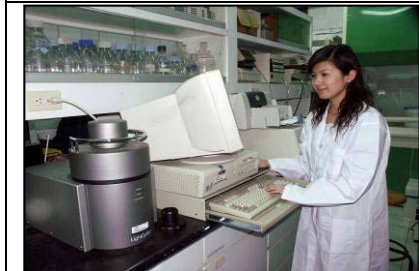
定量 PCR 系統