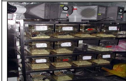
IVC 無菌小鼠飼養系統