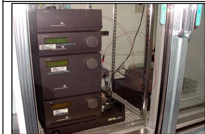
FPLC 快速蛋白層析系統