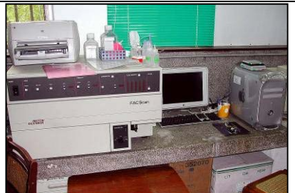
Flow Cytometry 流式細胞儀