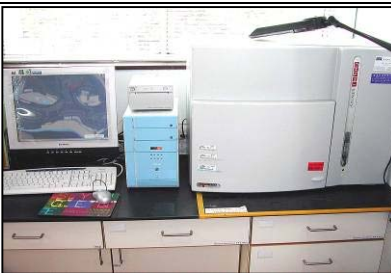
螢光光膠片照相系統