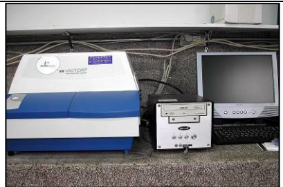
高通量盤式螢冷光分析儀