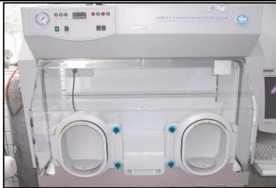
厭氧微生物操作培養系統