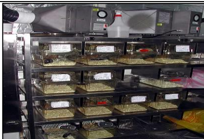
IVC 無菌小鼠飼養系統