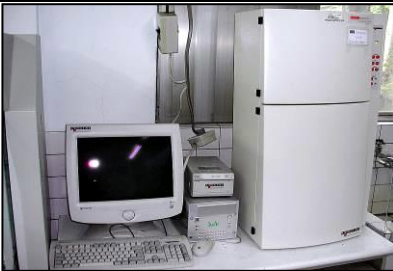
高解析膠片數位照相系統