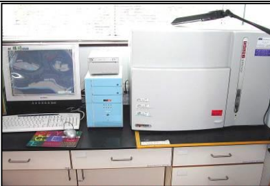
螢冷光膠片照相系統