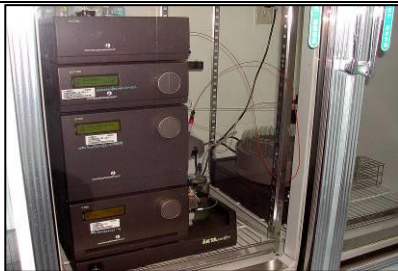
FPLC 快速蛋白層析系統