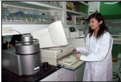
定量 PCR 系統