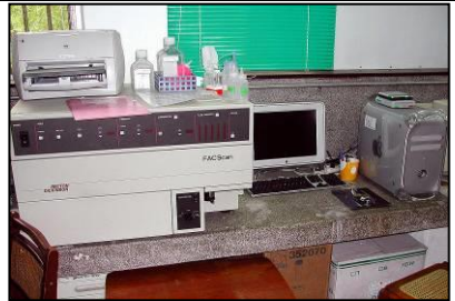
Flow Cytometry 流式細胞儀